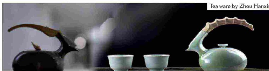
Tea ware by Zhou Hanxin

It's called "Essence Exploration" and it's the exclusive collection of works organised by the Polytechnic of Shenzhen , on display at the Fondazione Stelline in Corso Magenta. During Design Week (4-9 April), the best works of the artists who attend the Chinese university will be exhibited to show the two aspects of artisan tradition and modernity. A hundred works in metal and enamel, ceramics, jewellery, handbags, textile products and furniture in a dual display bear witness to artisan techniques deployed in avant-garde design. This is a new venture for a faculty of Art & Design from China and it is not by chance it originated in Shenzhen, the first Chinese city designated by UNESCO as a "City of Design".