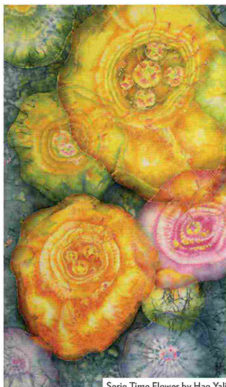
Serie Time Flower by Hao Yali